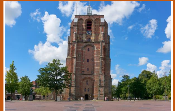
de stompe toren