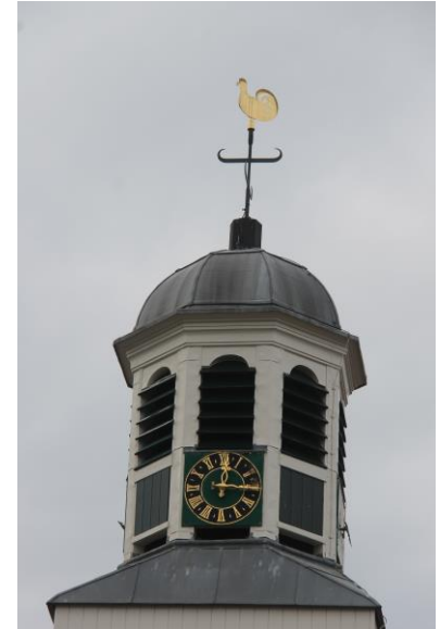
de ronde toren