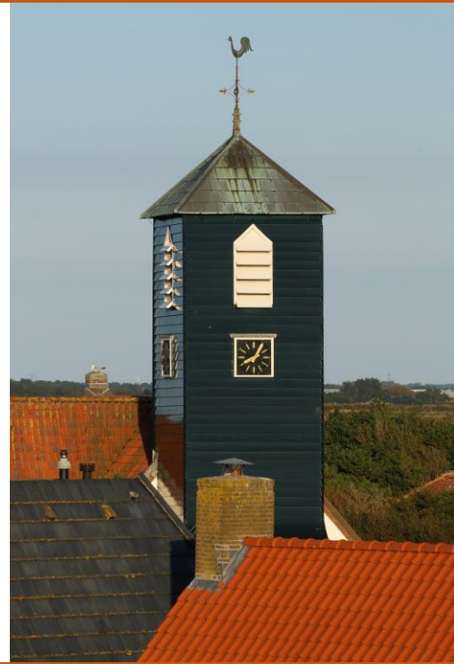
de vierkante toren