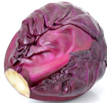
de rode kool