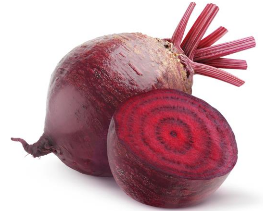
de rode biet