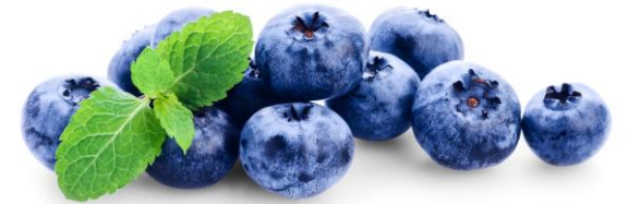
de blauwe bessen