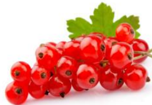
de rode bes