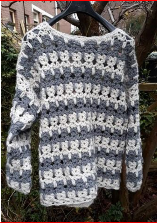
de gehaakte trui