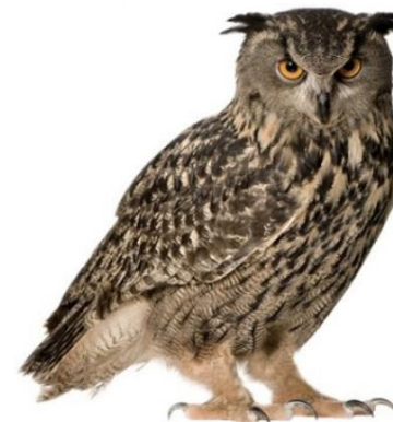
u i l