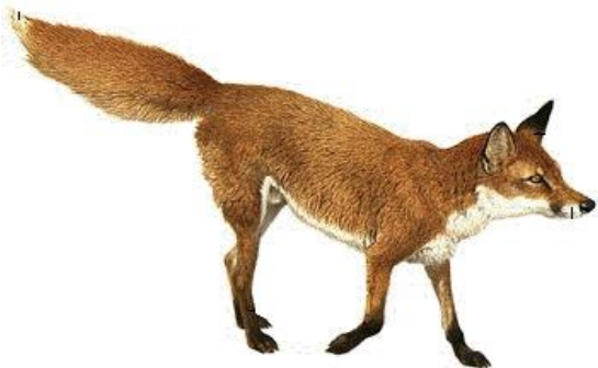
v o s