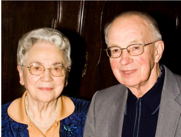
opa en oma