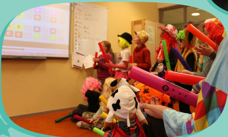
Mét o.a. boomwhacker meespeelvideo's