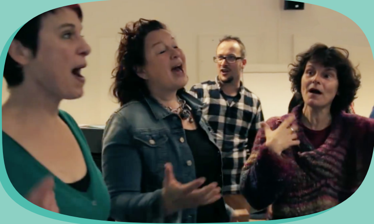
Deskundigheidsbevordering voor leerkrachten

“We wisten niet dat muziek zo leuk kon zijn. Iedereen kan het! Kinderen én leerkrachten zijn enthousiast. Het geeft ons energie!”