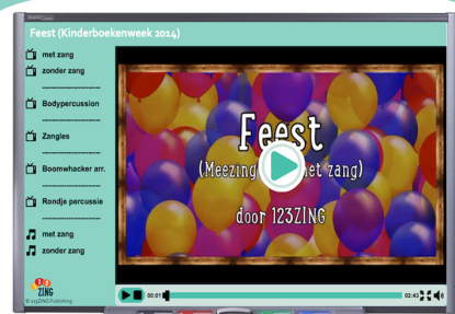
Liedjes en lesmateriaal op het digibord