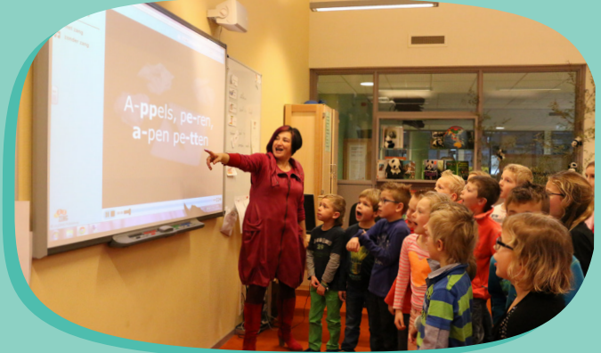
Muzikale digitale leeromgeving