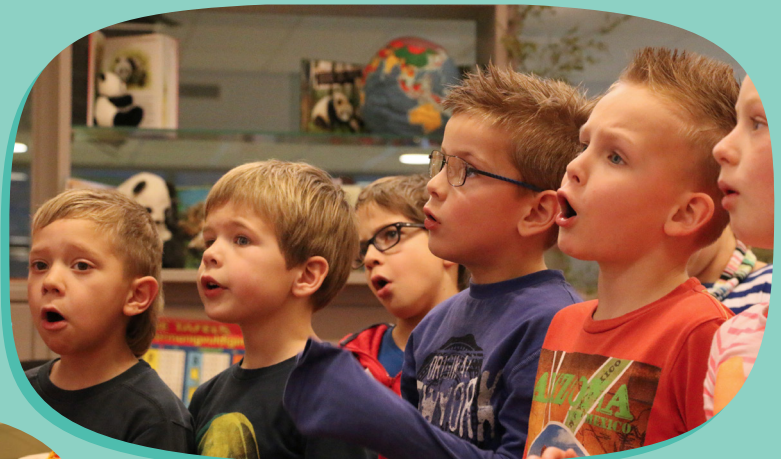
Voor groep 1 t/m 8