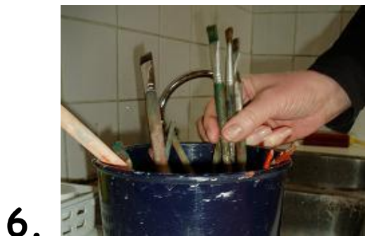
en in de pot zetten.