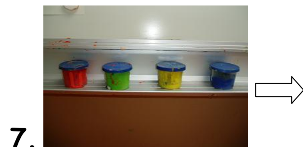
De potten sluiten