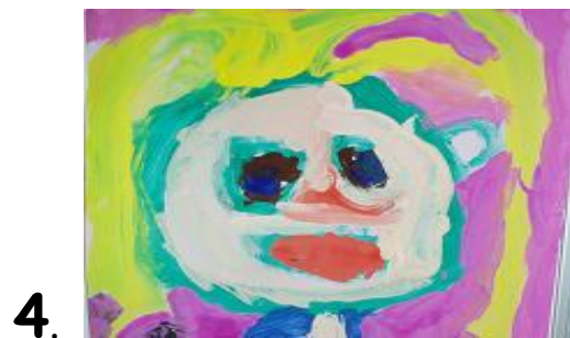
en schilderen !