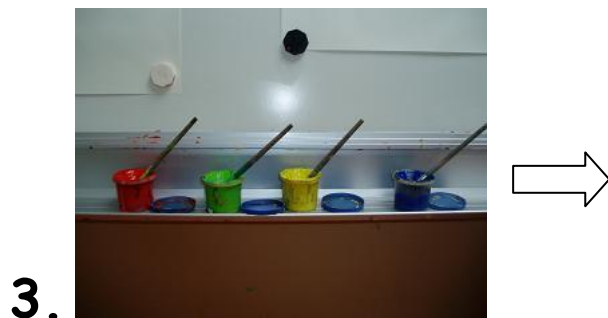
Kwast in elk potje doen