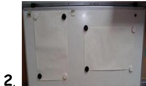
het papier ophangen.