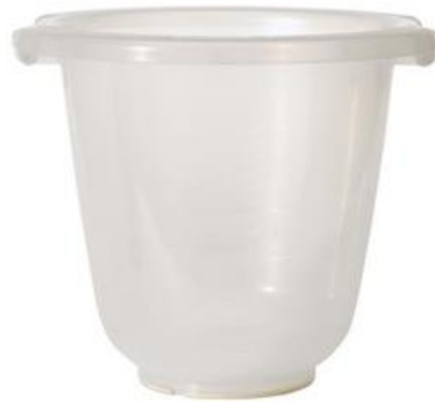
de tummy tub