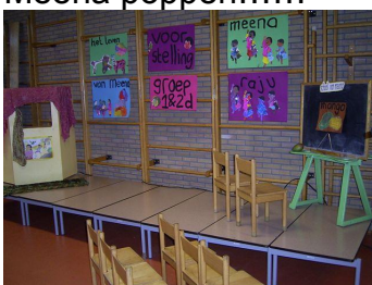
De voorstelling over Meena