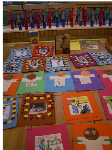
Werkjes en Meena en Rahju poppen