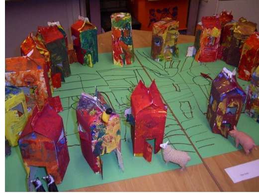
En hoe woon je zelf