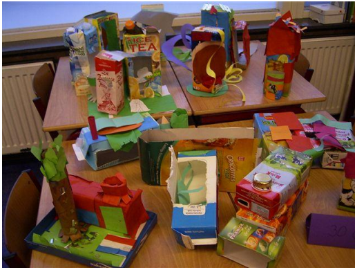
Verkoop van zelfgemaakt speelgoed door groep 3