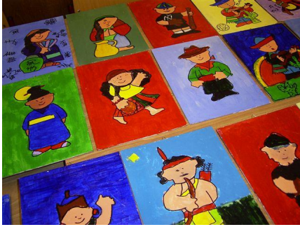
Groep 7 heeft prachtige schilderijtjes gemaakt en verkocht!