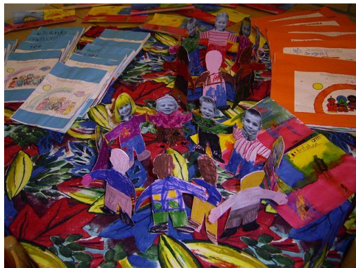
Een kring van kinderen bij de werkboekjes