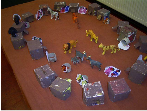
Hoe woont Meena