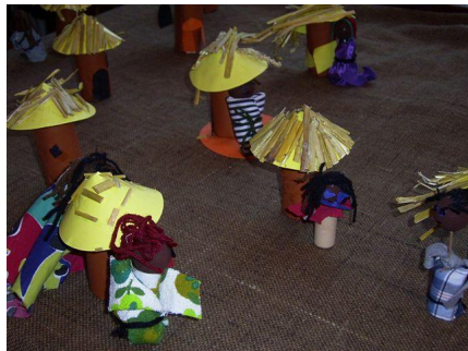
Huisjes in Afrika