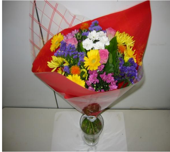
bloemen in de vaas