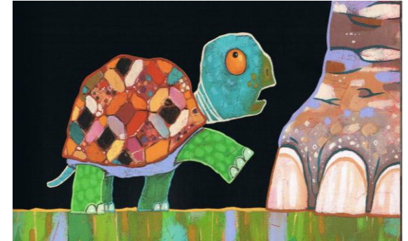
een supergrote voet